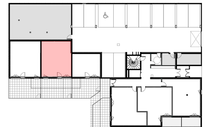
Plan du RDC ECH : 1/500