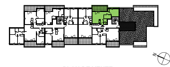
PLAN DE VENTE