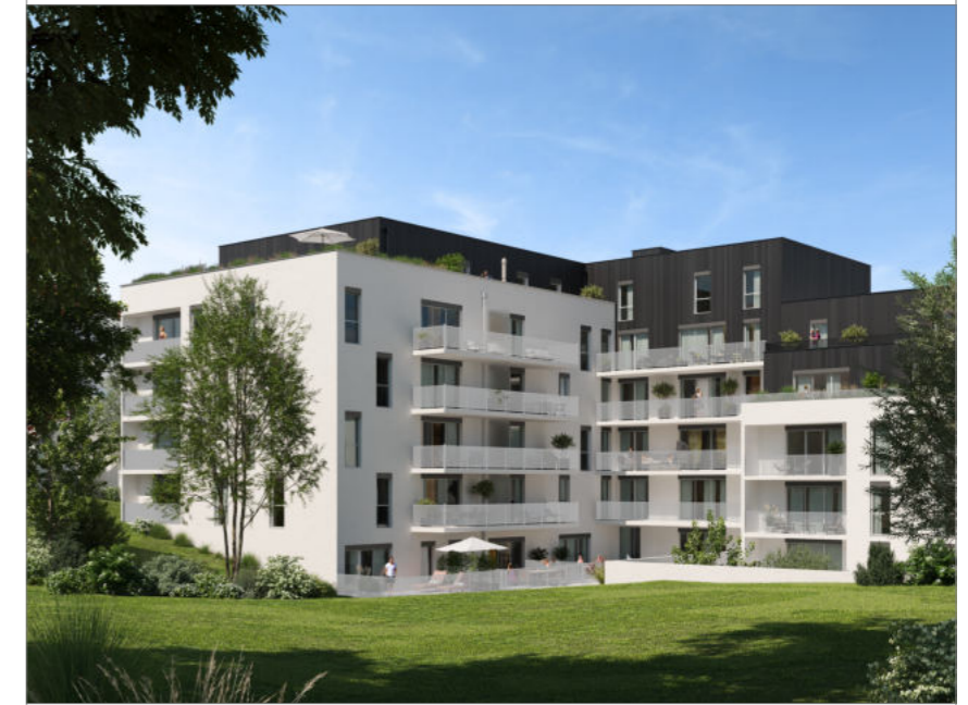
Logement 5.04 T4 - R+5