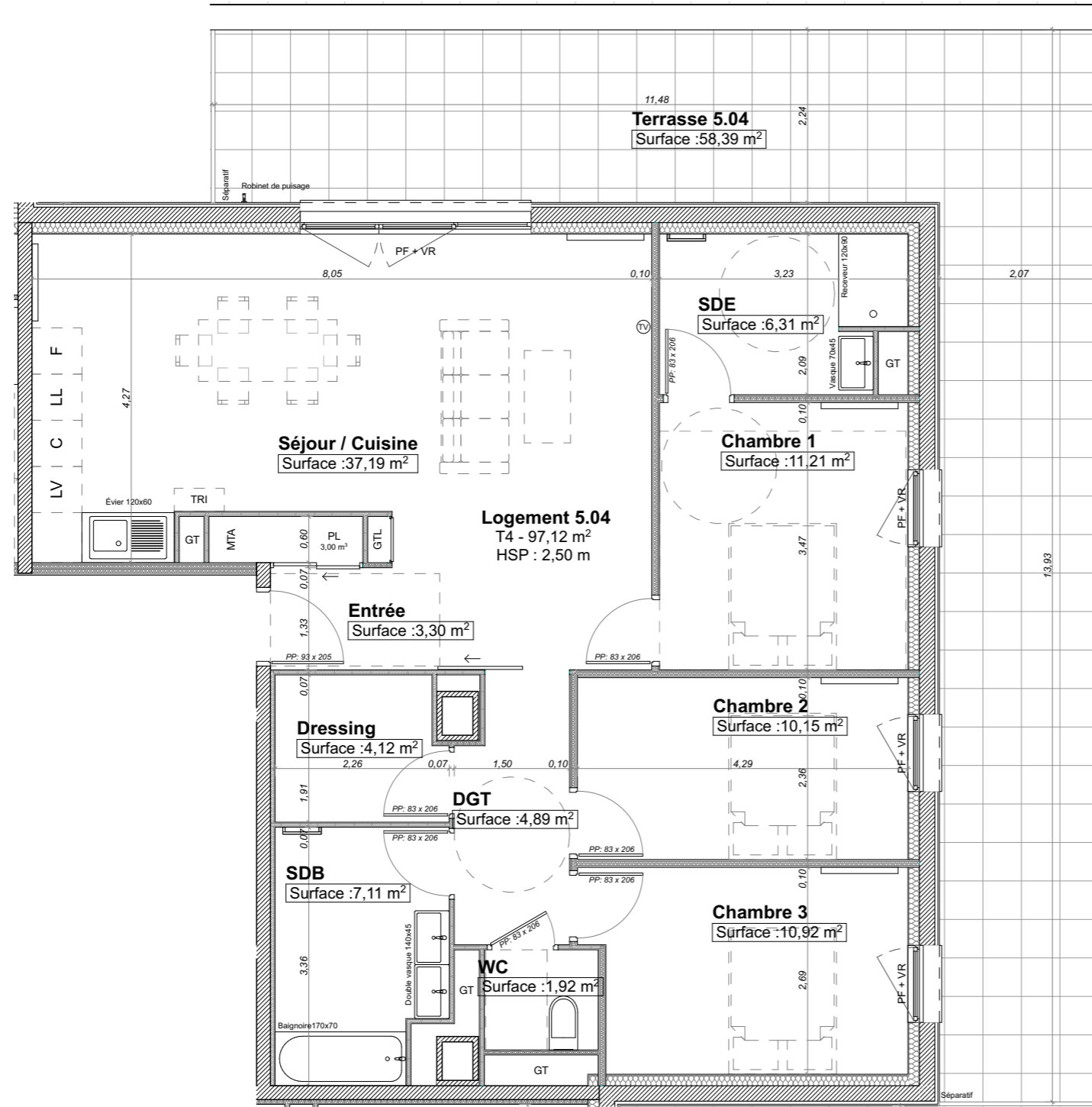
Plan du Logement 5.04 ECH : 1/75