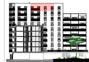
Façade jardin - Est

ECH : 1:100 DATE : 09/04/2024 INDICE : 06